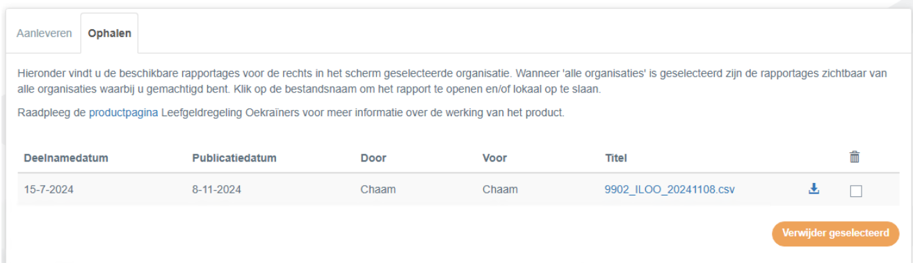
Figuur 6. Ophalen bestand

Let op: De rapporten worden op grond van de vastgestelde bewaartermijn na 3 maanden automatisch van het portaal verwijderd. Indien u ze langer wilt bewaren kunt u de rapporten lokaal opslaan.